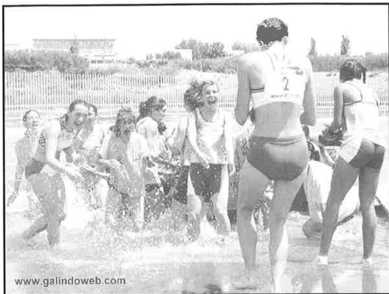
La celebración del ascenso