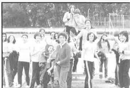
Equipo campeón nacional juvenil femenino de clubes - Junio 1976