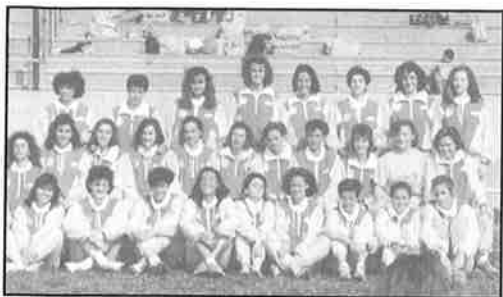
Cuando el equipo era TINTORETTO-1988