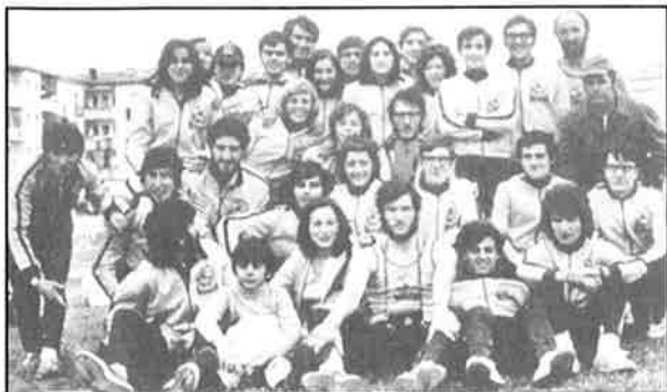
El primer viaje a la pista de Pamplona-1972