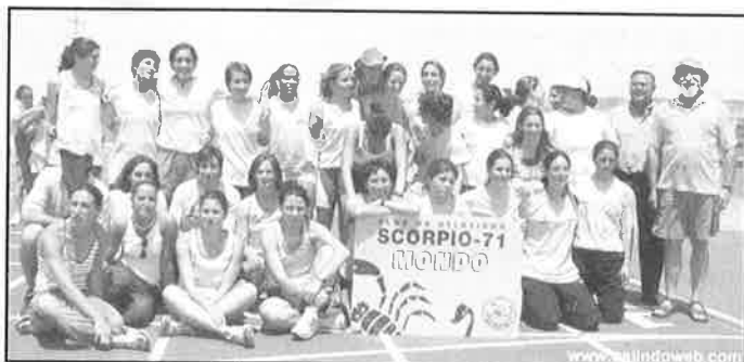
El ansiado ascenso a División de Honor en junio de 2002