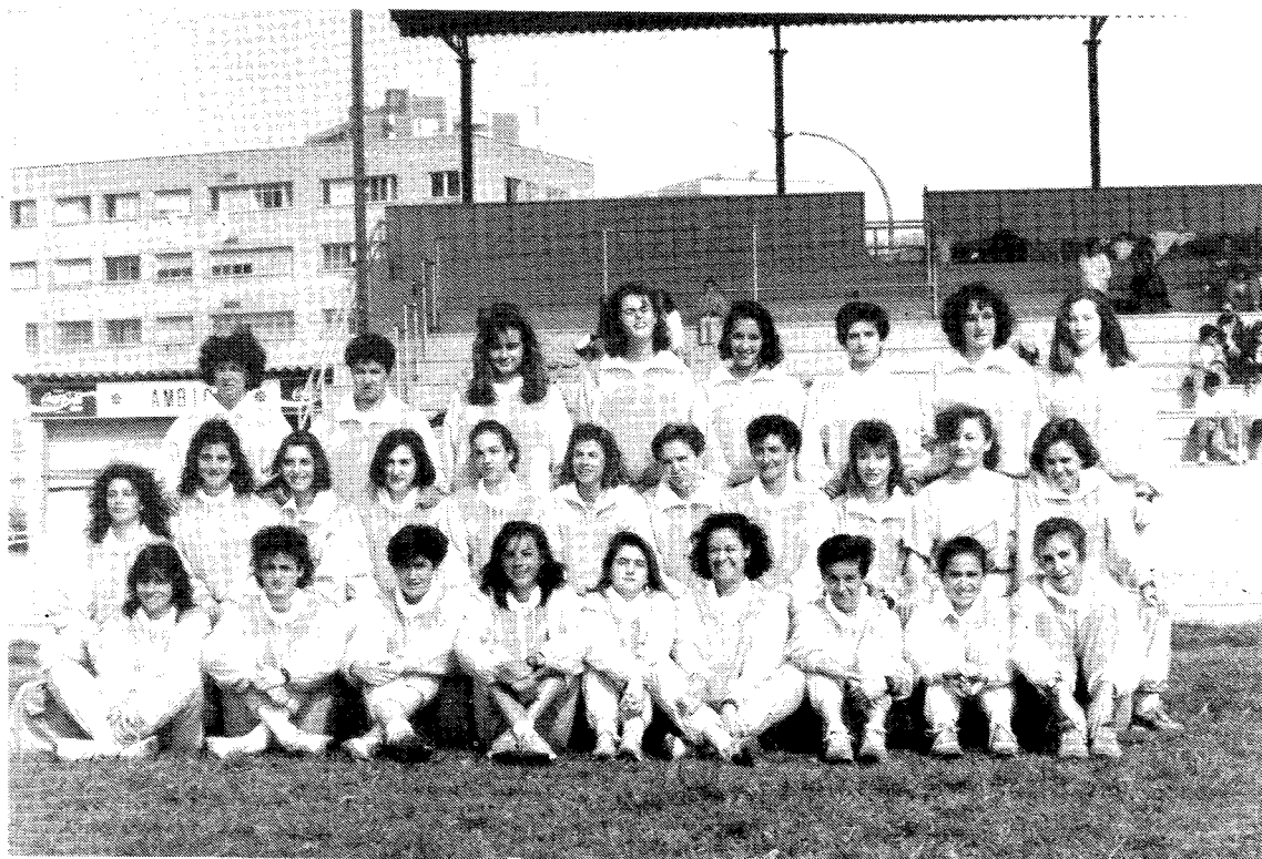
Primera aparición pública del nuevo equipaje.